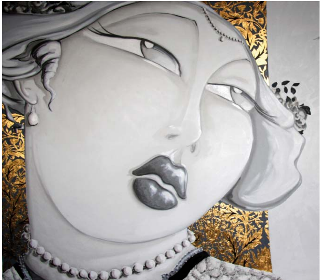
Lucrezia Borgia I 330x180 olio su tela e foglie oro 2009

In uno dei momenti più importanti del design e dell'arte Italiana a Verona, la settimana di "Abitare il tempo e ArtVerona 2009", Highlight propone una installazione originale " Home Armonia Concept", un percorso tra l'arte di Thomas Diego Armonia e la creazione di manufatti per l'arredo firmati dall'artista.